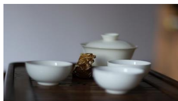
Das Weisse Gold