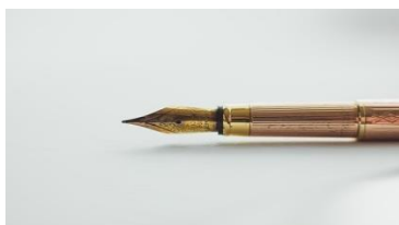
Die Kunst des Schreibens

Das enorm vielseitige jüdische Erbe ist ein wichtiger Teil einer Deutschlandreise. Wir sehen es als einen eminenten Beitrag, die Erlebnisse von Holocaust Überlebenden zu hören, Erinnerungsstätten zu besuchen und die Bedeutsamkeit der jüdischen Kultur in früherer Zeit zu erläutern.